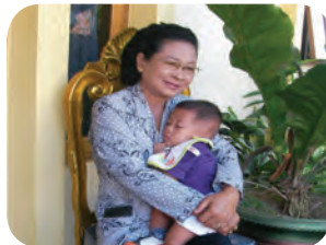
Gambar : 1.5 Ibu menggendong bayi