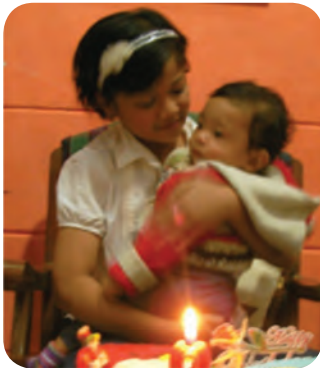
Gambar. 1.2 Anak yang masih kecil dan anak yang lebih besar

Guru mengajak anak-anak untuk mengamati gambar anak laki-laki dan perempuan: