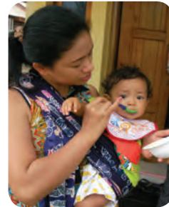
Gambar : 1.6 Ibu menyuapi anaknya

Dari pengamatan tersebut, guru mengajak siswa untuk menyampaikan pendapat, kesan, tanggapan, atau pertanyaan mengenai gambar atau foto yang mereka lihat.