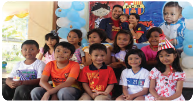
Gambar. 1.3 Anak laki-laki dan perempuan