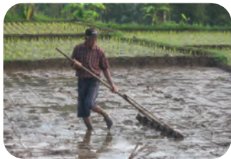
Gambar : 1.4 Bapak bekerja di sawah

Guru mengajak siswa untuk memperhatikan gambar atau foto yang menunjukkan kebiasaan yang dilakukan oleh perempuan dan laki-laki di dalam kehidupan sehari-hari. Misalnya gambar seorang ibu yang sedang menggendong bayi sambil menyuapi, memasak, mencuci, dan kebiasaan lainnya. Di sisi lain, guru juga dapat menunjukkan gambar seorang bapak yang bekerja di sawah, menjadi sopir, nelayan, dan pekerjaan lainnya.